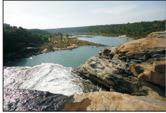
छत्तीसगढ़ की नैसर्गिक सम्पदा का विहंगम दृश्य